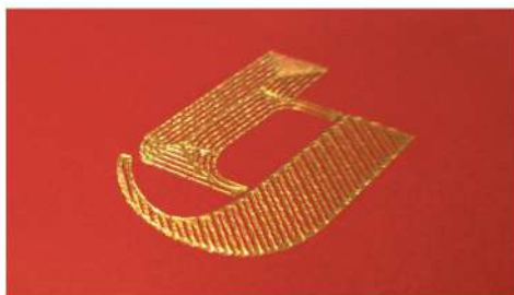
DORATURA SU COPERTINA MORBIPEL

Grande novità nel settore della stampa a caldo, Easyfoil è una stampante termografica digitale che sostituisce e rende obsoleti tutti gli altri sistemi di stampa a caldo, grazie al suo software innovativo che permette di riprodurre le immagini fornite in digitale. Non sono necessari impianti o cliché.