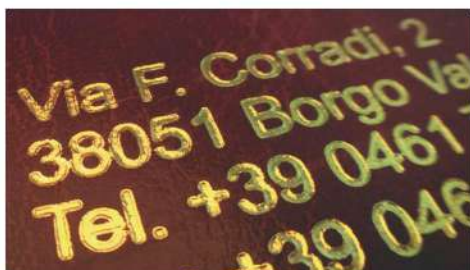
DORATURA SU COPERTINA TESI SIMILPELLE

Non sono necessari impianti o cliché. Particolarmente indicato l'uso per personalizzazioni su quantità ridotte, l'investimento è minimo: una buona termopressa e una piccola scorta di transfer specifici per i vari supporti su cui si intende lavorare.