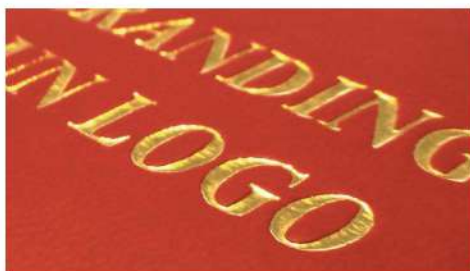
DORATURA SU COPERTINA MORBIPEL

Vengono utilizzati caratteri in ottone per riportare la scritta sulle copertine, è meno versatile delle macchine che lavorano riproducendo immagini in digitale (Easyfoil e doratore), ma è molto più precisa e garantisce una qualità superiore anche grazie all'effetto rilievo.