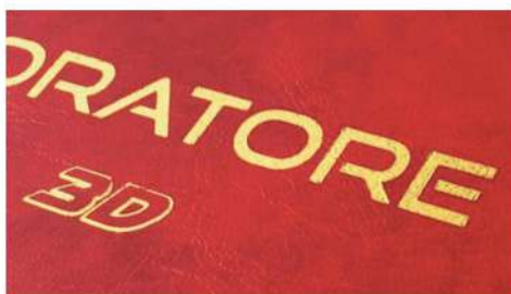
DORATURA SU COPERTINA TESI SIMILPELLE

Il kit di doratura è costituito da una speciale punta riscaldata che Tosingraf ha aggiunto all'incisore Roland DE-3, caratteristici i termini di precisione e rapidità, in modo da permettere la realizzazione di tratti anche molto sottili. Non sono necessari impianti o cliché.