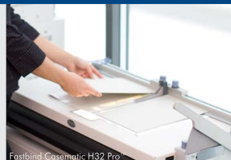
Fastbind Casematic H32 Pro™

BooXTer Duo dispone di un involucro integrato per fissare facilmente la copertina rigida o i contenuti pre-legati. Basta inserire la copertina nella scanalatura per mantenerla ferma e pelare poi i risguardi con le mani.