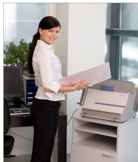
Libri, report o album fotografici in pochi minuti.