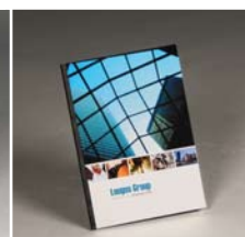
Larghezza libro Copertina rigida morbida