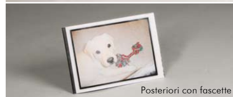
Posteriori con fascette