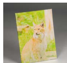
Larghezza libro Copertina rigida stampata*