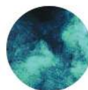
Polvere della carta, polveri ultrafini, particelle

L'aria pulita negli ambienti di stampa migliora dunque significativamente il benessere dei tuoi dipendenti. I tempi di inattività diminuiranno, mentre aumenteranno produttività ed efficienza. Allo stesso tempo si ridurranno anche le spese di pulizia e manutenzione delle attrezzature. Tutti costi che potrai facilmente evitare grazie ai purificatori d'aria IDEAL.