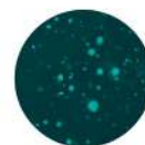
Ozono e biossido di azoto