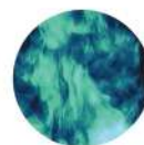
Prodotti chimici e vapori, composti organici volatili di inchiostri e detergenti