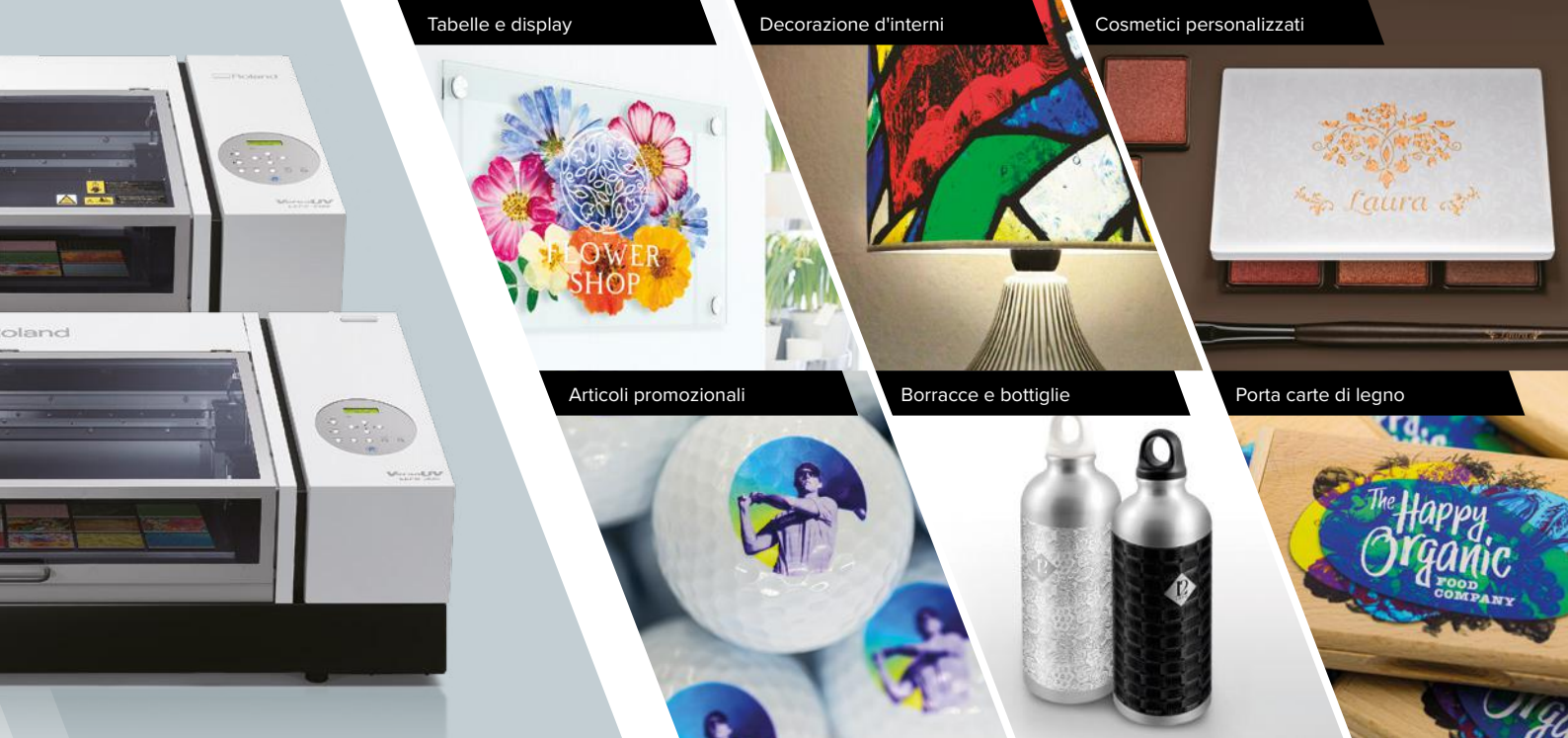
Tabelle e display