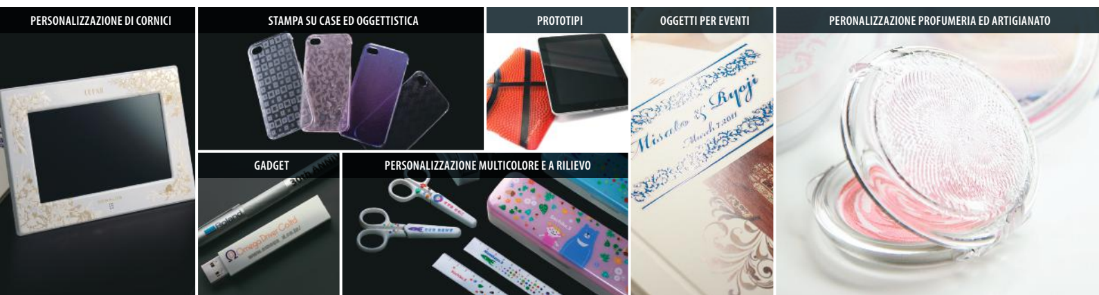
PERSONALIZZAZIONE DI CORNICI

con LEF-12 si possono realizzare piccole produzioni o anche pezzi unici. È perfetta per personalizzazioni su oggetti di pregio oppure per la creazione di targhe o placche con particolari effetti di lucidatura a rilievo o parti colorate.