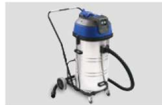
HSM ProfiPack 425 è disponibile con la predisposizione per il collegamento ad impianto di aspirazione (opzionale)