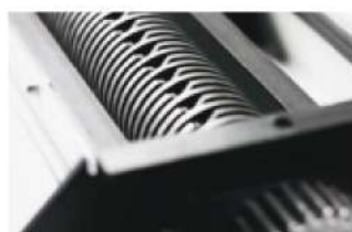
Cilindri di taglio con temperatura speciale per tagli di precisione