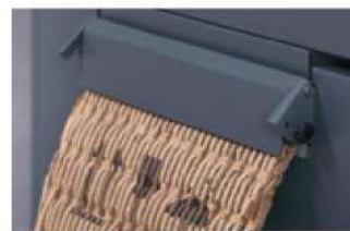
Creazione di materiale da imballo compresso con flap di compressione chiuso (due strati di cartone, HSM ProfiPack 425).