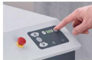
Velocità di alimentazione regolabile