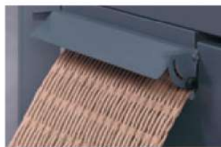
Creazione di tappetini imbottiti (uno strato di cartone, HSM ProfiPack P425).