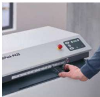
La scala millimetrata permette di regolare facilmente la larghezza del materiale come richiesto.