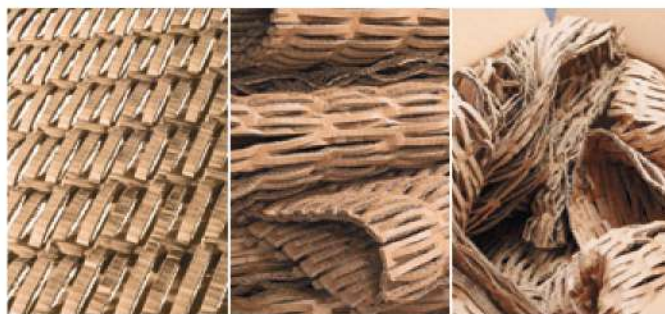
Il materiale da imballaggio può essere utilizzato per qualunque esigenza ed offre una protezione ottimale per gli oggetti – come tappetino imbottito, imballaggio imbottito e materiale di riempimento.