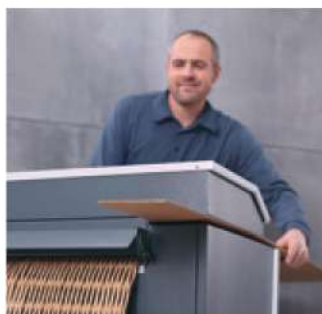
Taglio ed imbottitura in un unico passaggio.