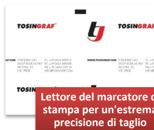
Lettores del marcatore di stampa per un'estrema precisione di taglio