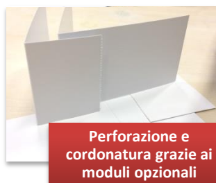
Perforazione e cordatura grazie ai moduli opzionali