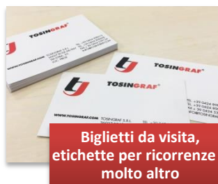
Biglietti da visita, etichette per ricorrenze e molto altro