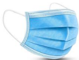
UNI EN 14683:2019