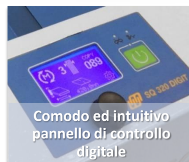
Comodo ed intuitivo pannello di controllo digitale