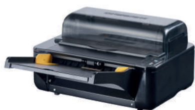
Dimensioni compatte che si adattano ovunque

Revo Any non è solo velocità, ma anche semplicità. L'intuitiva e rapida impostazione del lavoro permette a chiunque, anche se è la prima volta, di plastificare. Grazie alla sua avanzata tecnologia e ad una costruzione di alta qualità, puoi essere sicuro di ottenere sempre documenti nitidi e perfettamente rifiniti. Che tu abbia bisogno di plastificare documenti, foto o altri materiali, Revo Any farà sicuramente al caso tuo!