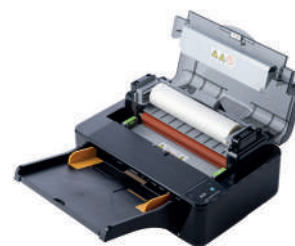
Semplice e rapido sistema per la sostituzione della pellicola di film