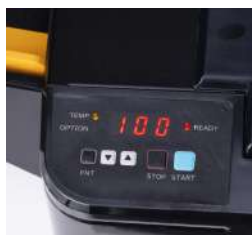
Carica i fogli e premi il pulsante di avvio. Revo Any plastificherà in modo completamente automatico